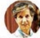
Isabel Allende Busti Senadora por la Región de Valparaíso