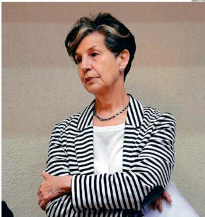
“HAY CONDICIONES PARA ESTABLECER UN DIÁLOGO Y RECTIFICAR EN LO QUE EL GOBIERNO SE HA EQUIVOCADO”, PLANTEA ALLENDE.

“Por qué votó a favor de la retroactividad?” “En octubre la ciudadanía me